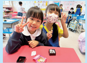
學生挑戰解開九連環

數學科藉著多元化的學習活動，如精英培訓班、數學校隊、速算大比拼、中國傳統益智遊戲、班際數學比賽、電子速算王、數學小老師、數學電子課業、校外比賽及跨科目專題研習等，提升學生的邏輯思維及計算技巧，也讓學生體驗各類活動。本校利用多元化教學策略及資源，將資訊科技融入於數學科的學與教中，讓學生加深對數學概念的理解及運用，培養學生運用數學解決問題、推理及傳意的能力，並提高學生對學習數學的興趣。