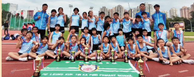
田徑隊於大埔區校際田徑比賽屢獲佳績