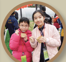
品嚐美味有機食物