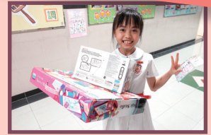
學生換領彩虹貼紙獎勵計劃的禮物

學生成長與家長支援息息相關，因此本校亦舉辦不同的家長講座及親子活動，與家長分享學生成長路上的種種經歷，家校合一，讓學生在一個充滿愛和鼓勵的環境下成長。