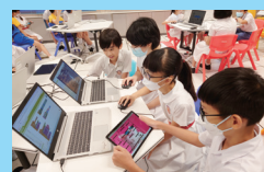
Android App 編程