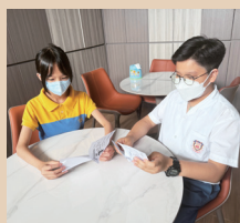
能量加油站小主播