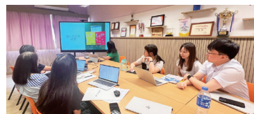
教師與中大 QSIP 同事進行議課與評課

常識科透過手腦並用的學習經歷及解決問題的過程，培養學生的創造力。課程的設計著重培養學生的探究精神及發展學生「學會學習」的能力。六年級常識科與中文科合作，學生在常識課篩選、整理、分析資料，並歸納重點；在中文科作文課時，學生則運用已整理的資料進行議論文寫作。