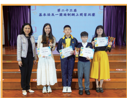
第二十三屆基本法及一國兩制網上問答比賽 師生分別榮獲不同組別亞軍和優異獎