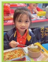
品嚐美味的蘿蔔湯