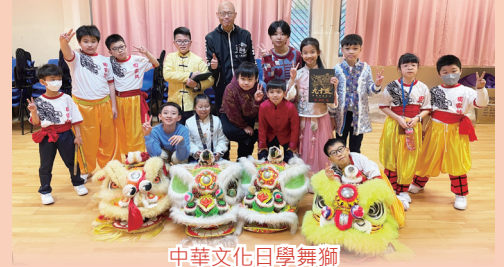
中華文化日學舞獅