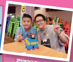
「LEGO® SERIOUS PLAY®」親子工作坊