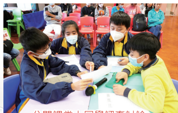
公開課堂上同學認真討論

中文科連續兩年參加中文大學的「優質學校改進計劃」(QSIP)，目的是建立學生自主學習的態度和能力。本年度支援人員與六年級中文科老師以《筆下風景畫》單元作規劃，以自評循環設定學習目標，以讀帶寫規劃設計課堂活動。學生在過程中建構筆記，並透過分層提問、小組合作、個人練習等，促進學生深化學習，提升課堂參與度及培養高層次思維能力。