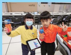
初級智能裝置製作