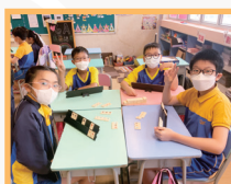
創意解難及魔力橋校隊