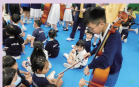
弦樂隊到幼稚園進行服務學習