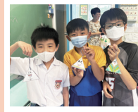
田小中華藝萃端午粽子活動

另外，小五中文科課程新增製作盆菜的課題，讓學生了解盆菜的起源和食物的寓意，亦與視藝科合作教授學生中華傳統工藝美術紋飾、瑞獸紮作等藝術創作。