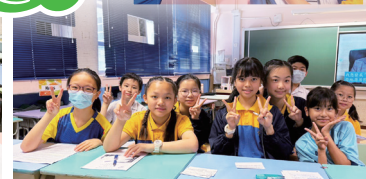
學生為辯論做準備