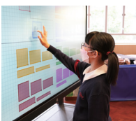
學生進行電子探究活動