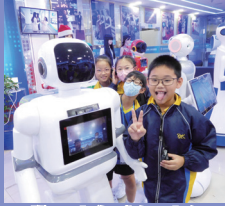
機器人為我們引路