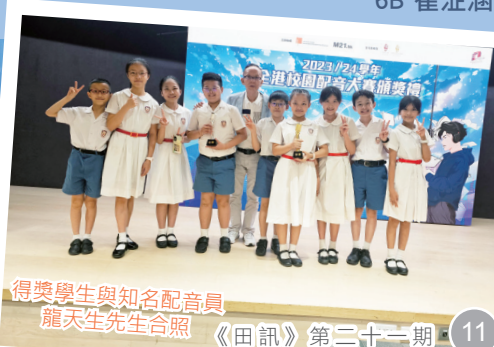
得獎學生與知名配音員 龍天生先生合照