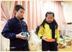
Students had to say a word each time they hit the ball

As usual, we have Halloween Day and English Fun Fair to increase students' exposure to English. This year, we have several key initiatives. First, the AI Book Cover Design program allows the English and Computer Studies departments to collaborate and teach students how to use AI platforms to design book covers for their favorite books. Secondly, our Gifted Education for All program enables students to further develop their language arts skills during regular English lessons. Additionally, our all-year-round Fun Friday features engaging themed activities each semester, from Songs Dedication to Movie Friday, One-minute Challenges and News Reports. Finally, Fun Room activities enable students to play games with English Gurus and chat with Mrs Sengupta using English on Wednesdays.