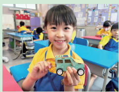
製作拉線小車初探能量轉換