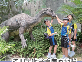
深圳大鵬半島國家地質公園博物館

五年級學生以「深圳自然環境及歷史文化探索之旅」為交流主題。學生透過交流活動認識深圳的古火山地貌及各地的岩石和礦物晶石，並了解環境保育的重要。透過遊覽大鵬古城，學生能認識古城的歷史，了解文物保育的重要，以及體會國土安全的重要。