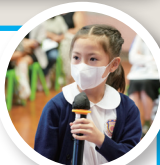
學生匯報討論結果

本年度，數學科參與香港中文大學的「優質學校改進計劃」(QSIP)，旨在推動學生的自主學習。在四年級的「面積」單元教學中，科任教師設計一系列電子探究活動，讓學生深入理解面積與周界之間的密切關係。在公開課堂上，學生熱烈參與，並主動探究問題，收穫豐碩。此外，數學科更與保良局屬校設計一款有關「八個方向」的桌遊，當中融入了保良局的歷史和精神，讓學生寓學習於娛樂，成效斐然。