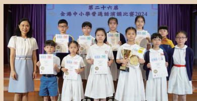
多名學生於第二十六屆全港中小學普通話演講比賽2024獲獎