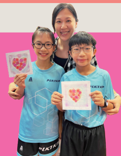
和諧紛彩親子工作坊

家長更會參選成為家教會委員，參與會議及組織活動，並協助學校監察和檢討午膳、校服、書簿及校車供應商的服務質素。透過持續的緊密溝通，家長與學校建立起共同的信念，提升學生對學校的歸屬感，增潤學生豐富多元的學習經歷。