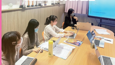
中大專家與中文科老師進行備課