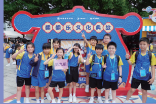
深圳自然環境及歷史文化探索之旅