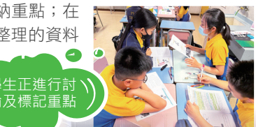
學生正進行討論及標記重點