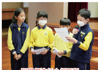
同學們進行小組匯報