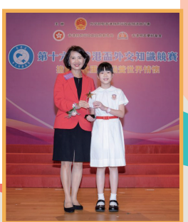
第十六屆香港盃外交知識競賽 小組冠軍、最佳表現學校獎及踴躍參與學校獎