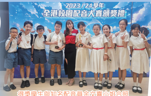
得獎學生與知名配音員余文熹小姐合照