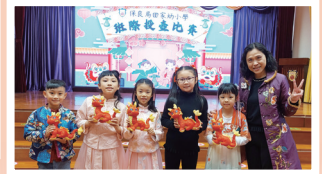
中華文化日班際投壺比賽