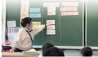
Students made their own sentences using the key structure