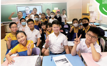
學生於課堂進行自由辯