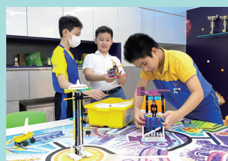
學生為 Lego 機械人大賽作準備

本校致力推行 STEAM 教育，包括校本資優課程（VR 動畫設計、人工智機械車、無人機編程）。另外，在校內外亦有舉辦及參與各種活動以推廣 STEAM 教育，如 STEAM Day、Code Monkey 編程自學平台、創作@大埔、電車模型 STEM 課程及電車廠參觀、香港城市大學 AI&STEM 資優課程及 DNA 課程、香港教育大學編程及 STEAM 嘉年華。除此，本校亦積極參與各項校外比賽，讓學生擴闊眼界，如 CoolThink 運算思維比賽、保良局 145 周年屬下小學電子挑戰賽、香港學界創意紙飛機競技大賽、AI 藝術創作大賽《以書畫之名》、小學 OhBot 機械人 STEAM 短片創作比賽、國際青少年創科奧林匹克大賽。