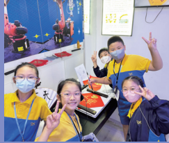
參觀深圳機器人產業園