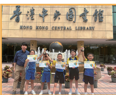
第二十六屆「常識百搭」小學STEAM 探究展覽嘉許獎及優異獎