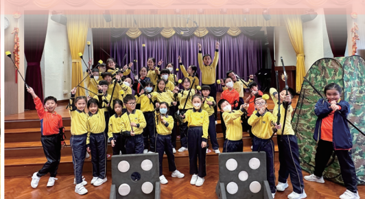
小三小四攻防戰體驗活動