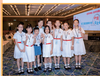
第三屆全港青少年中國文化和旅遊知識競賽 初小組個人及團體季軍、高小組個人季軍及 團體亞軍