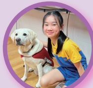
「導盲犬·耆樂三人行」愛心嘉許之旅