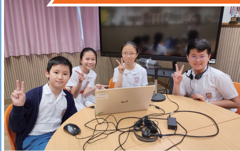
參賽學生進行配音訓練