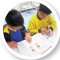
Students were matching key words with pictures using graphic organizers

The CUHK partnership and our internal professional development initiatives demonstrate our commitment to improving English learning through innovative teaching and teacher empowerment.