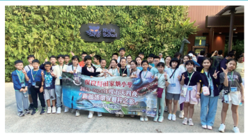
新加坡夜間動物園

參觀牛車水和小印度，令學生了解早期新加坡人的生活和歷史，更了解新加坡的多元文化。