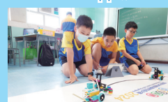
LEGO 機械車設計及編程