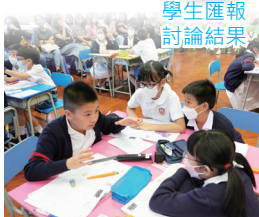
學生進行小組討論