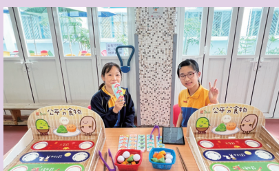
價值觀教育I Junior攤位遊戲