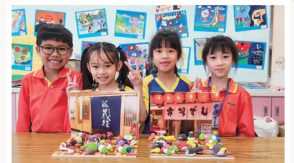
一、二年級主題：精明小食家