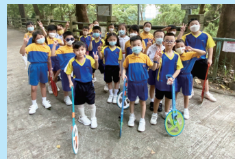
學會使用滾輪來量度