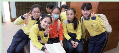
參觀基本法圖書館