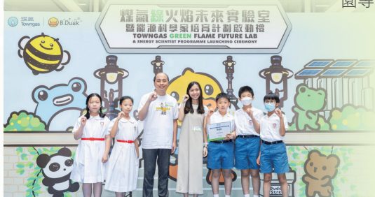
參與煤氣公司能源科學家培育計劃