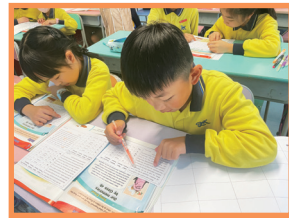
Students locate key words in the text