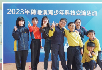
學生出席穗港澳科技交流