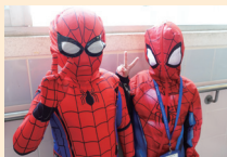
Look! Students dressed up as Spider-Man! How adorable!