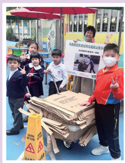
「尋找拾荒的老友」生命故事教育講座及展覽

本校價值觀教育活動包括：大埔區公民教育運動委員會「大埔區中小學電影放映會暨反思徵文比賽」、大埔區警民關係組升旗及步操訓練、宣明會逃出氣候災難講座、「考基本·尋法寶」基本法推廣活動2024、「尋找拾荒老友」生命故事教育講座及展覽、「導盲犬·耆樂三人行」愛心嘉許之旅、價值觀教育I Junior攤位遊戲及街坊小子木偶劇場等。