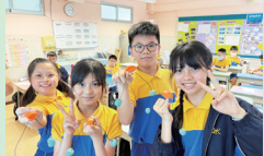
使用胡蘿蔔製作平衡玩具