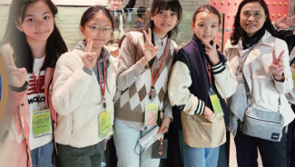
校長與同學齊參觀寧波博物館