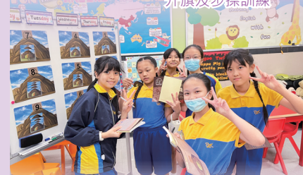
「考基本·尋法寶」《基本法》推廣活動