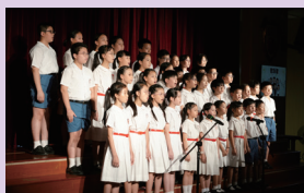
歌詠隊於音樂成果分享會表演