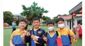
五年級主題：大埔祈福文化