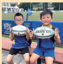
保良局攬球同樂日

體育科通過常規課程及校隊訓練，教授體育技能和知識，培養學生正面價值觀和態度，促進積極健康的生活方式。藉着多元化的體育活動，包括球類、花式跳繩、舞蹈、田徑、游泳訓練、聯校陸運會、班際競技比賽、跨學科研習及武術課，全面協助學生發展體育潛能和建立運動習慣。