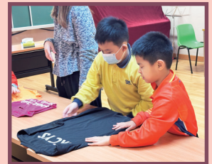
小二自律自理小組