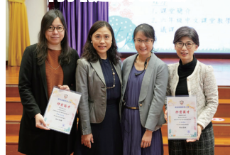
陳校長、嚴老師與中大專家合照