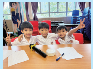
各班派出代表參加班際數學比賽