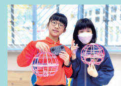
參與無人機足球比賽