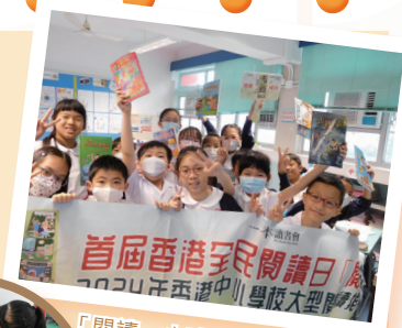
「閱讀一小時」讀書挑戰活動

「4·23世界閱讀日」攤位遊戲活動、互動劇場《正義村奇幻遊記》、「認識和保護知識產權」學校講座、香港會計師公會「窮小子富小子」聽故事學理財活動、賽馬會數碼「悅」讀計劃、「主題圖書活動」、「校園小主播」閱讀實踐課程、「4·23世界閱讀日」校本活動、「閱讀一小時」讀書挑戰活動、香港全民閱讀日—中小學聯校共讀半小時、優化自主閱讀添樂趣、「童·閱·樂」體驗學習活動《花開的時候》、「香港小學生書籤交換計劃」、參觀基本法圖書館及大會堂公共圖書館、故事媽媽培訓工作坊、「篇篇流螢」網上跨課程廣泛閱讀計劃、「書唔兇」閱讀網站及「小校園」。