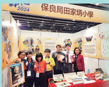
創科@大埔展覽展出學生的創作