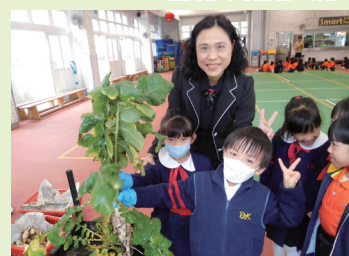
小一學生種植蘿蔔