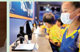
利用顯微鏡觀察豐年蝦卵