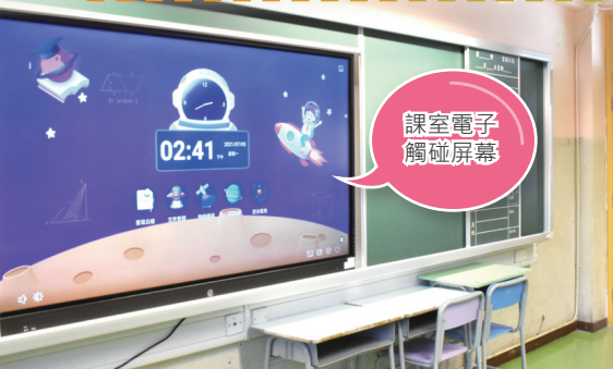
課室電子觸碰屏幕